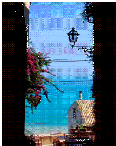
Torre di Palme

A Monte Vidon Combatte è da vedere la Chiesa Parrocchiale di San Biagio caratterizzata dal settecentesco campanile con cella campanaria mentre ad Ortezzano da non perdere sono la Torre Ghibellina , le mura quattrocentesche, i portali e le volte in stile gotico.