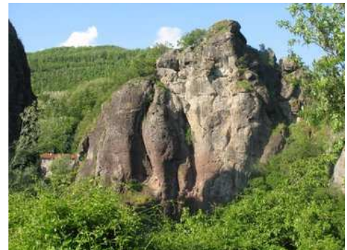
Piazza al Secchio

Da questo punto possiamo portarci sulla strada del ritorno in Direzione Carrara e Massa o salire al passo di Cerreto a quota 1200 m.s.l. prendendo per Frizzano e proseguendo per la S.P.63 lungo un percorso stradale un po' impegnativo fino al Passo che si trova nell'Appennino reggiano.