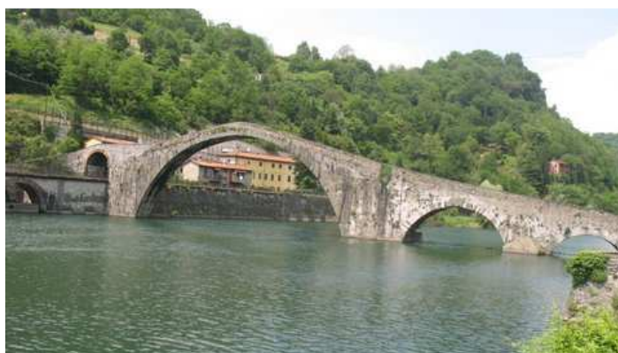
Borgo a Mozzano: Il Ponte del Diavolo

http://www.borghiditoscana.net/it/toscana/lucca/borgo_a_mozzano/ponte_della_maddalena.html