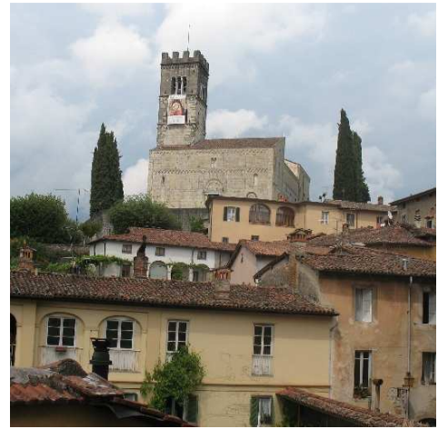
Barga: il Duomo

http://www.borghitalia.it/html/borgo_it.php?codice_borgo=196