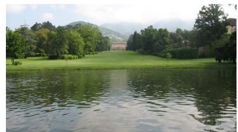
Marlia: Villa Reale

http://www.cultura.toscana.it/architetture/giardini/lucca/villa_torrigiani.shtml