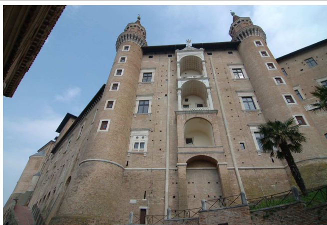
Urbino: "Palazzo Ducale"

Parcheggio sotto la fortezza Alborno, a sinistra in fondo a viale Buozzi: a pagamento i primi 100 m, gratuita e con spazi più ampi la zona vicina all'ingresso della fortezza, nei giorni feriali giungere dopo le 17:30 per trovare un idoneo