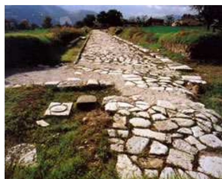
Fossombrone: "Area Archeologica"