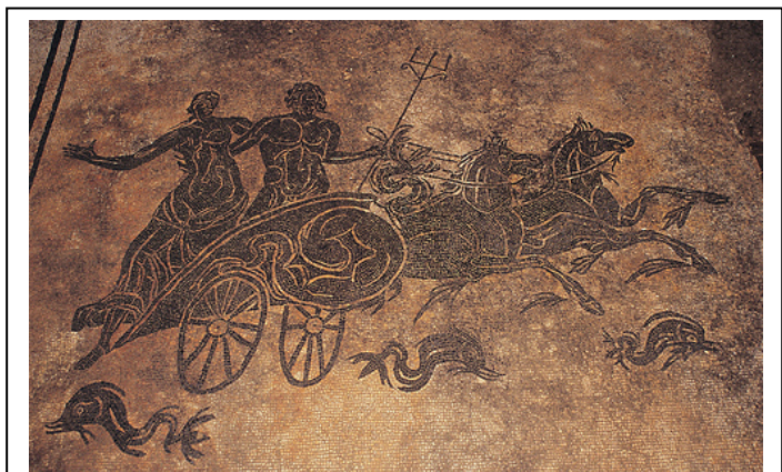
Sant'Angelo in Vado: Domus del Mito

Chiesa di Santa Maria Extra Muros con annessa pinacoteca, Chiesa di Santa Caterina delle Bastarde, Chiesa di San Filippo, il borgo con la Torre Civica ; il