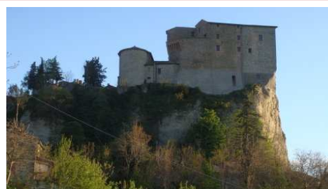
S. Agata Feltria : Rocca Fregoso

Ampio parcheggio in piano, alberato posto all'ingresso del paese, idoneo anche per una sosta notturna.