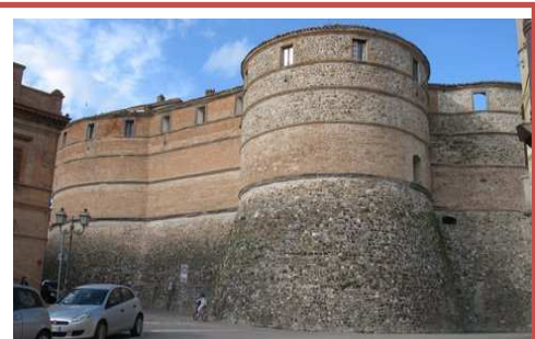
Sassocorvaro: Rocca Ubaldinesca

Parcheggio davanti il Castello. Area Attrezzata in via dello Sport vicino alla Scuola N 43° 43'30" E 12°24' 46"